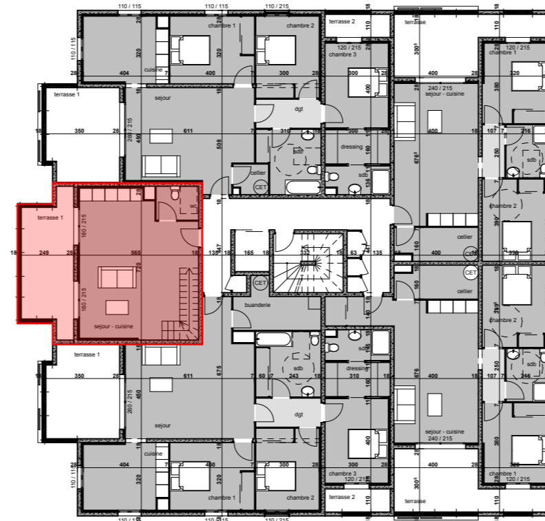
TABLEAU DE SURFACES