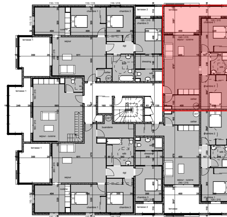
TABLEAU DE SURFACES